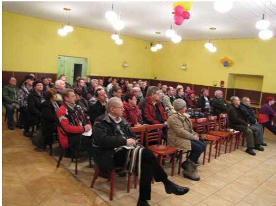
Kilkudziesięciu mieszkańców Cieszyna wybrało się na spotkanie z burmistrzem, aby dowiedzieć się więcej m.in. na temat sposobów wykonania przyłączy kanalizacyjnych.

dziej nurtujące ich pytania związane z zakończoną inwestycją oraz skonsultowania indywidualnych przypadków związanych z przyłączeniem się do nowej sieci kanalizacyjnej.