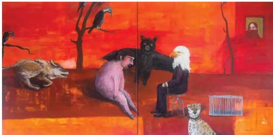
Jedna z prac artystki Agnieszki Swobody.

Tegorocznym tematem targów jest SZCZĘŚCIE, więc w tej dyskusji nie zabraknie takich pytań jak: „Czy sztuka czyni cię szczęśliwym?”, „Czy sztuka może być