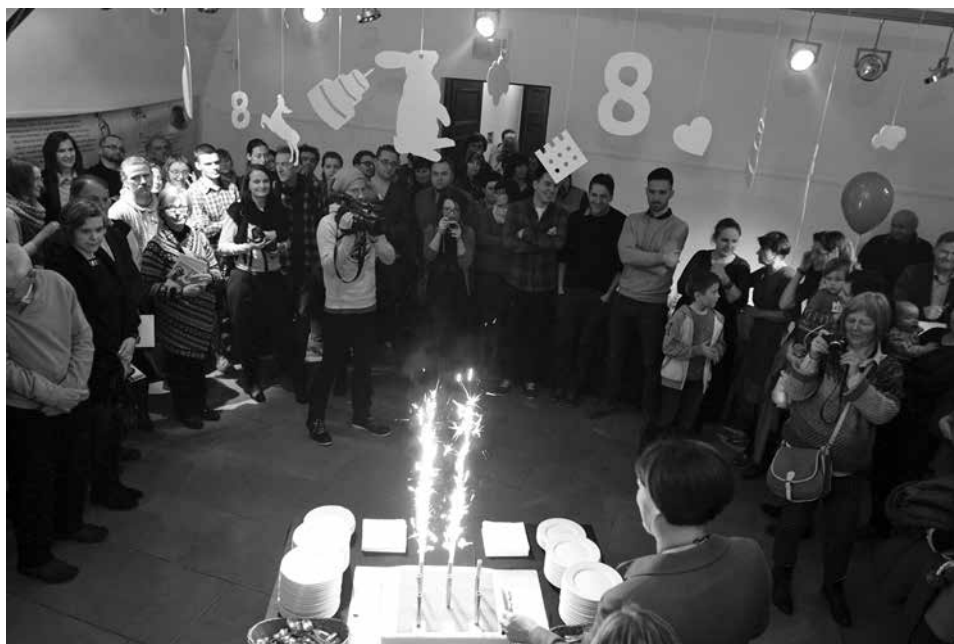
Podczas urodzinowego spotkania nie może zabraknąć gości i ... tortu.

Powinniśmy doceniać wartość współpracy – taką platformę stworzyła Dobroteka w Dobrodzieniu, organizując dla projektantów i firm warsztaty. Ich efekty można zobaczyć na wystawie „Dobry Tydzień Projektanta”.