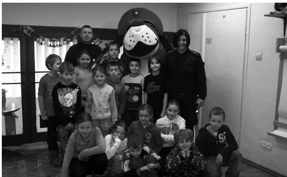
Niecodzienną atrakcją podczas spotkania z dzielnicowymi była obecność policyjnej maskotki - psa SznuPKa.

Spotkanie ze stróżem prawa to dla dzieciaków duże przeżycie, zaś spotkanie z policjantem zachęcającym do wspólnej lektury, co więcej, czyniącym to w towarzystwie ogromnego psa SznuPKa (maskotki śląskiej Policji), to nie lada gratka.