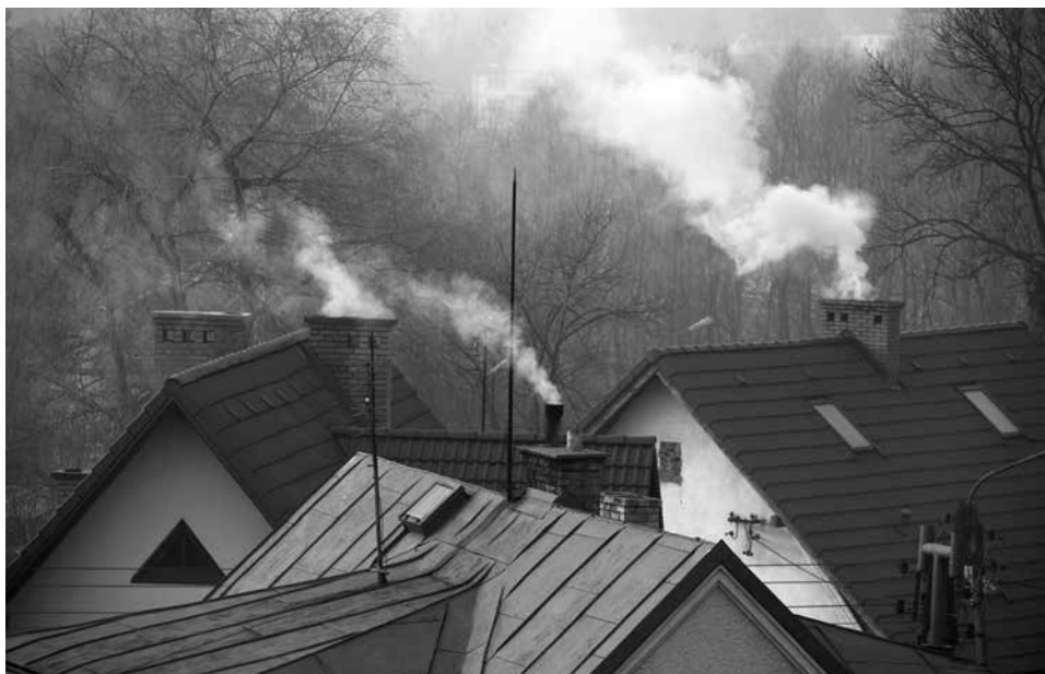
Problem fatalnej jakości powietrza tkwi także w naszych piecach i w paliwie, jakiego używamy do ogrzewania domów i mieszkań.

Niska emisja to również emisja komunikacyjna i emisja pyłów i szkodliwych gazów z lokalnych kotłowni węglowych i domowych pieców grzewczych, w których spalanie węgla odbywa się w nieefektywny sposób (przestarzałe i nieefektywne urządzenia grzewcze nie gwarantują optymalnych warunków dla spalania!). Najczęściej stosuje się węgiel tani, a więc o złej charakterystyce i niskich parametrach grzewczych. Taki węgiel ma dużą domieszkę siarki, popiołu i mułu węglowego, a przy jego spalaniu szczególnie intensywnie uwalnia-