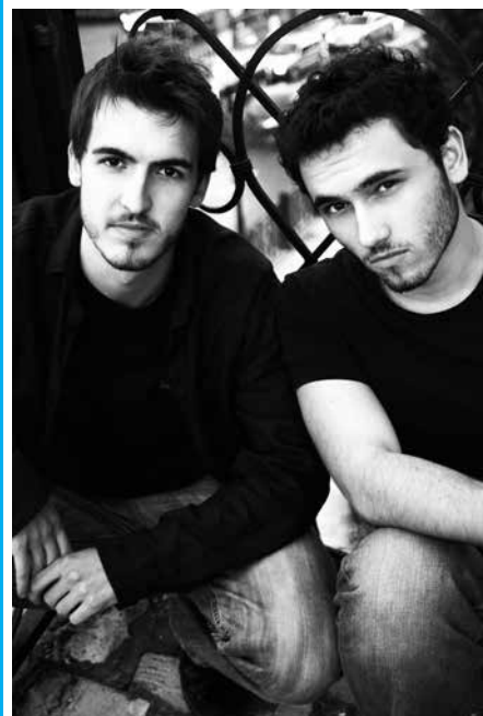
Dzień Kobiet warto spędzić słuchając muzyki w wykonaniu duetu Riffertone.

Rozkład ważny od 17.02.2013 r. Za zmianę rozkładu odpowiada przewoźnik.